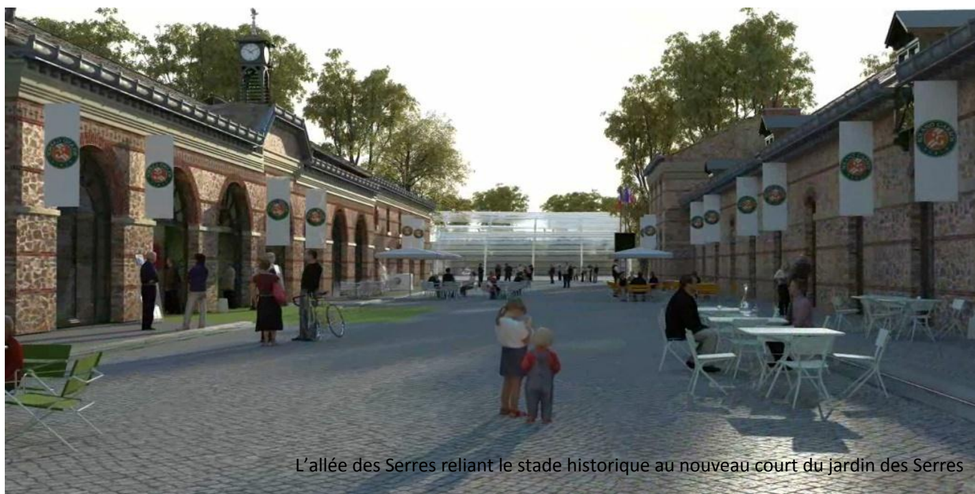
L'allée des Serres reliant le stade historique au nouveau court du jardin des Serres

Dans la réflexion d'ensemble de réorganisation du stade, le restaurant « Le Roland-Garros » sera déplacé et prendra place à l'angle de l'avenue Gordon-Bennett et du boulevard d'Auteuil, en utilisant l'actuel Pavillon d'octroi. Au Nord du stade (côté Bois de Boulogne), un nouveau centre de presse « high-tech » sera construit en lieu et place de l'actuel Centre National d'Entraînement. Il sera surplombé par un restaurant panoramique qui offrira une vue imprenable sur l'ensemble du site, la ville de Paris et de ses environs.