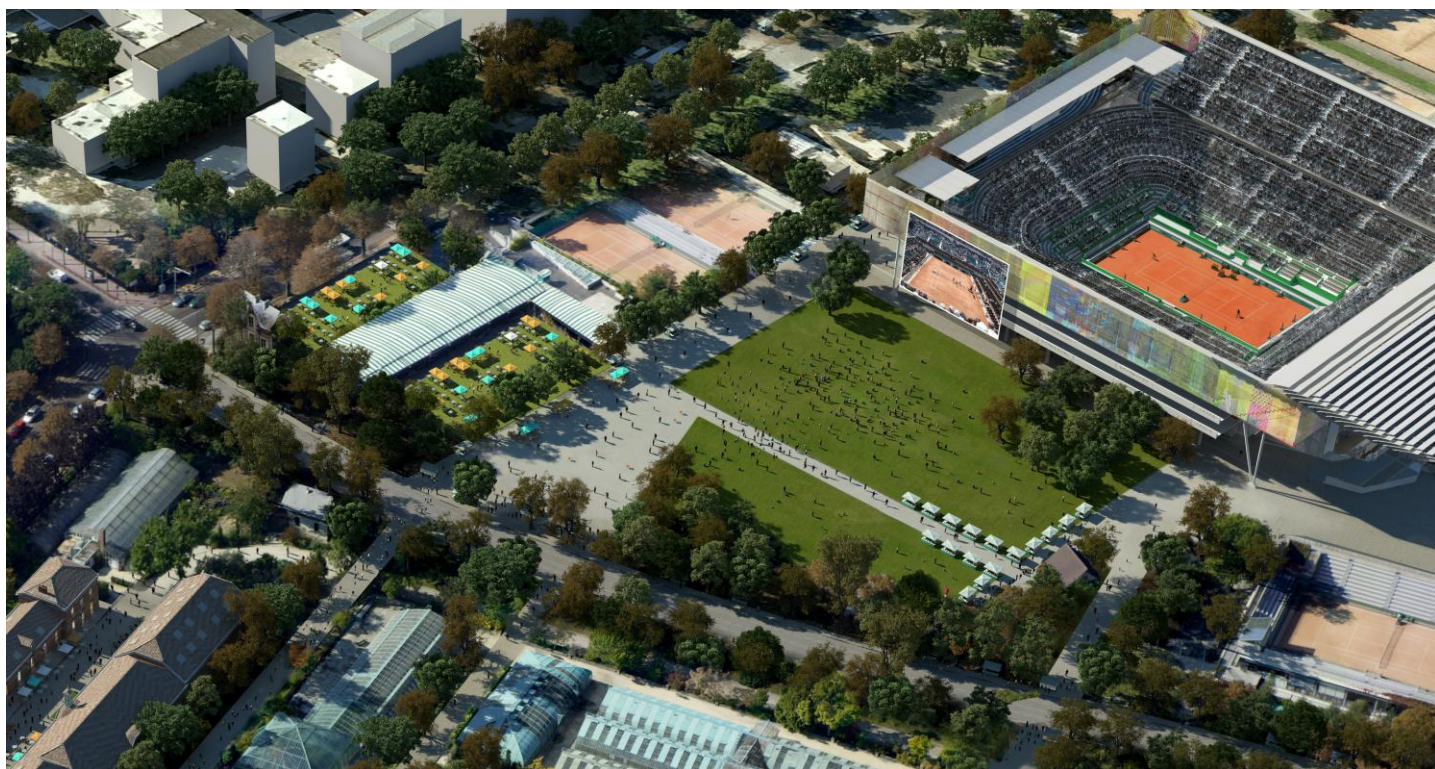
La nouvelle place des Mousquetaires et le futur court Philippe-Chatrier

Symbole du nouveau Roland-Garros, le court Philippe-Chatrier sera entièrement repensé dans sa conception. S'il conservera sa capacité actuelle de 15 000 places, son réaménagement intérieur garantira un confort accru à l'ensemble des populations, et notamment au public, en investissant les angles (ouverts aujourd'hui), en offrant une nouvelle continuité « curviligne » aux tribunes et en proposant davantage de sièges bas au grand public.