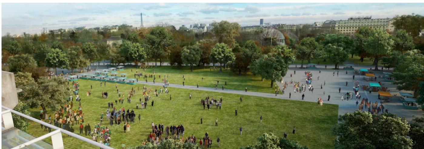
La nouvelle esplanade de la Place des Mousquetaires, vue du court Philippe-Chatrier

Dans cette nouvelle configuration, il sera possible d'accéder au stade par de nouvelles entrées, et notamment de la Porte d'Auteuil (proche des transports en commun), via le Jardin des Serres d'Auteuil.