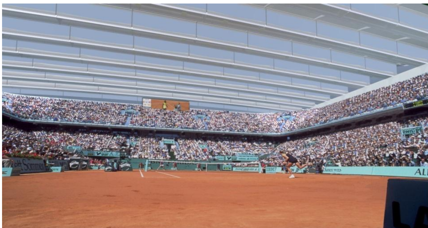
La couverture amovible du nouveau court Philippe-Chatrier

Si, de par leur caractère unique et exceptionnel, les Internationaux de France contribuent largement aujourd'hui au rayonnement international de Paris, ils jouissent aussi des avantages liés à leur situation unique dans Paris intra-muros et notamment d'un prestige, d'un emplacement et d'une accessibilité hors norme. Aujourd'hui, le stade est ainsi desservi par deux lignes de métro, onze lignes de bus, et profite d'une desserte nationale et internationale sans comparaison possible.