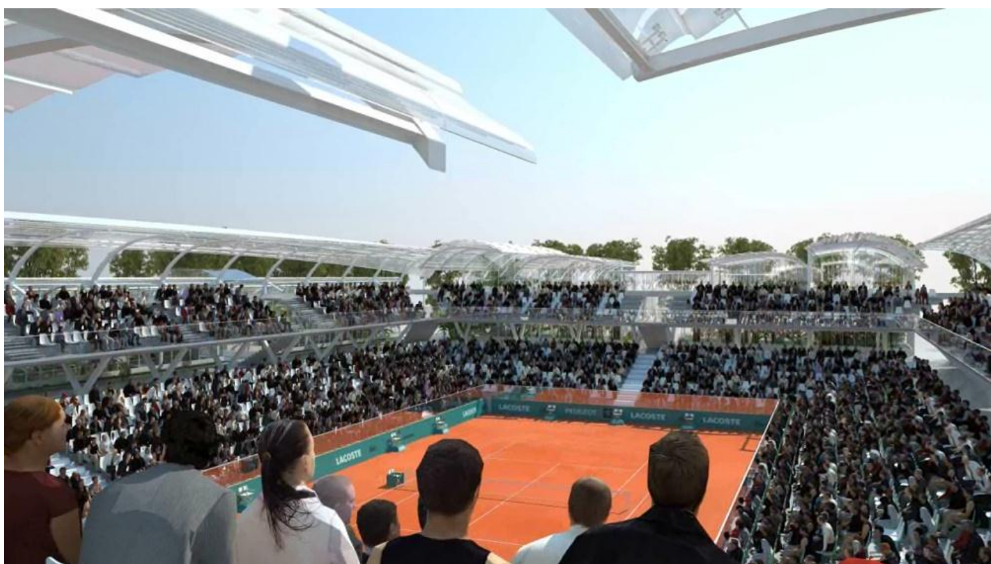
Le nouveau court du jardin des Serres d'Auteuil

A proximité, le court n°1 sera détruit pour faire place à la réalisation d'une vaste esplanade d'environ un hectare. Les spectateurs trouveront sur la nouvelle Place des Mousquetaires, arborée, aérée, totalement ouverte avec une vue directe sur le court Philippe-Chatrier, un espace de détente, convivial, où il sera possible de se restaurer ou de regarder des matches sur écran géant.